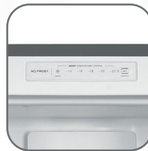
Control digital interior