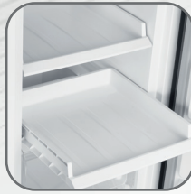
Bandejas de plástico