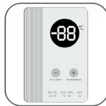
Termostato exterior digital