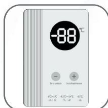
Termostato exterior digital