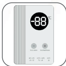
Termostato exterior digital