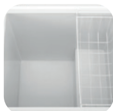
Interior de acero prepintado