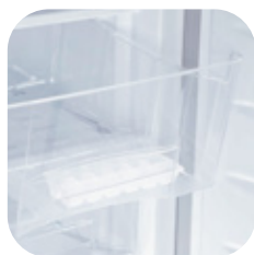
6 cajones termoplásticos